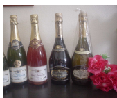
Carte d'Or Rosé Prestige Jéroboam